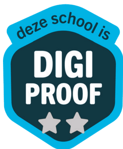
Op weg naar volledig DIGI-proof!