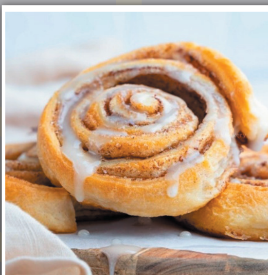
Lekker om te maken! - Cinnamon rolls